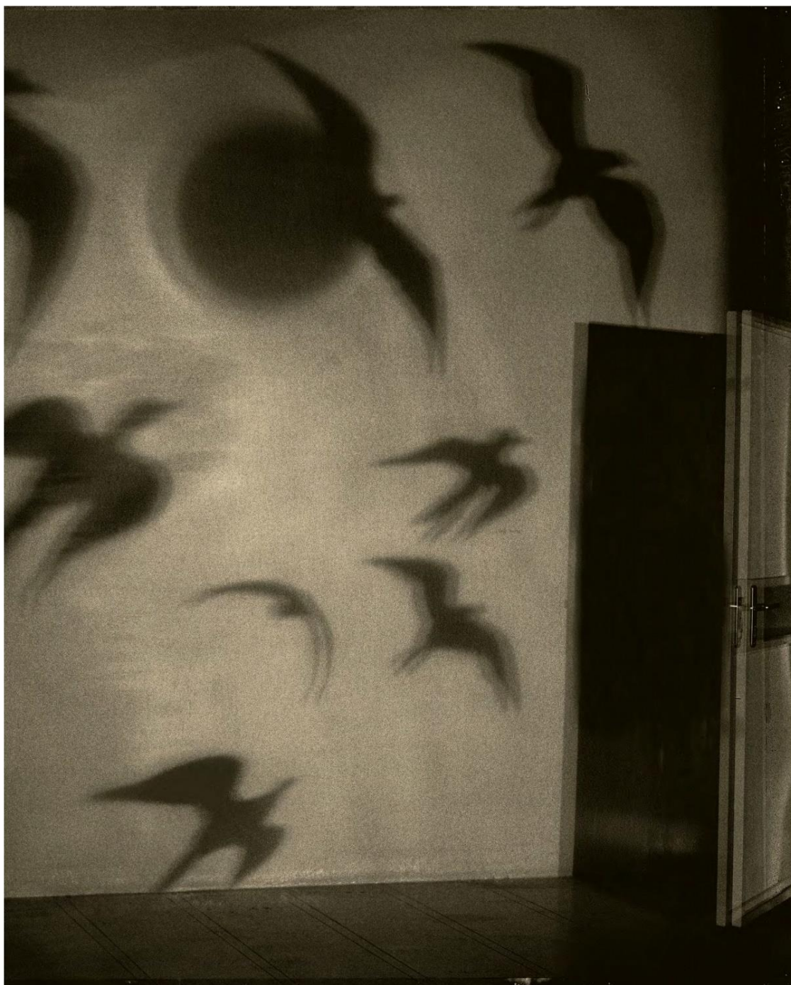
Le studio aux oiseaux